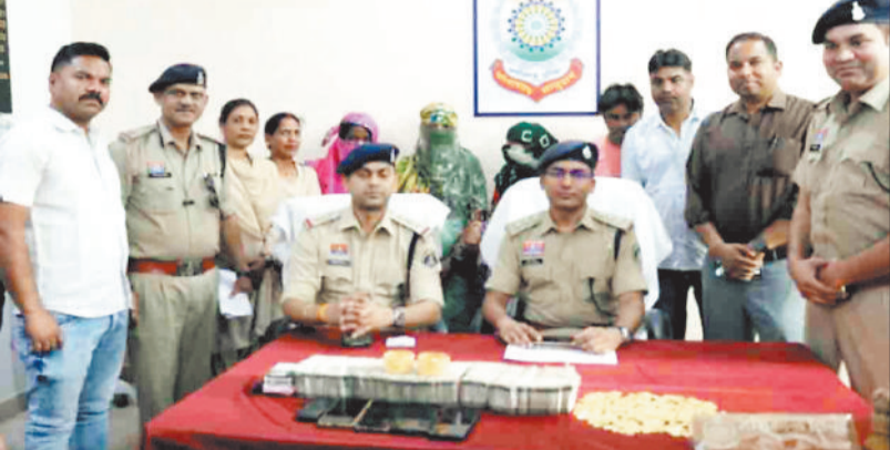
मामले की खुलासा करते सीएसपी, जब्त रूपए व आरोपी।

■ पुलिस ने 20 लाख नकद सहित 37 लाख कीमत के सोना व सामान किया बरामद